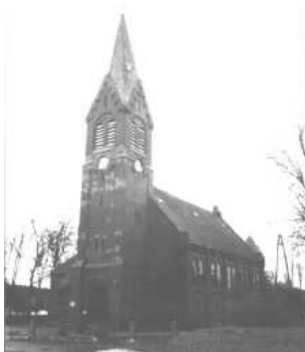
Die ehemalige evangelische Kirche in Neu Barkoschin 1998

Im Jahr 1897 wurde der neugotische Kirchenneubau mit Hilfe des Gustav-Adolf-Vereins vollendet. Generalsuperintendent D. Döblin weihte sie am 19. August 1897 unter Assistenz des Superintendenten Dreyer aus Pr. Stargard und weiterer Pfarrer der Region. Als Vertreter des Staates wohnten Oberregierungsrat Moehrs aus Danzig und der Berenter Landrat Hans Trüstedt den Festlichkeiten bei. Das Dorf hatte sich eigens für diesen ersehnten Anlaß herausgeputzt und auch beide Kirchen geschmückt. Aus der alten Kirche wurden nach einer kurzen Abschiedsfeier die Heiligtümer herausgetragen und zur neuen Kirche gebracht. Pfarrer Wilhelm Dedlow wurde der Schlüssel gereicht und die 1.500 Gläubigen, die die Kirche gerade fassen konnte, strömten hinein. Die alte Kirche wurde vermutlich anschließend abgetragen. 1980 fand man bei Renovierungsarbeiten eines Wohnhauses in Neu Barkoschin angekohlte Balken, die aus der alten Kirche stammen sollen.